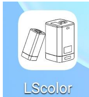
安装完成后 APP 图标